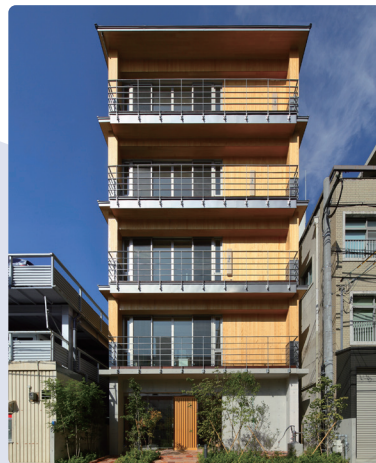
ぶろぼの福祉ビル