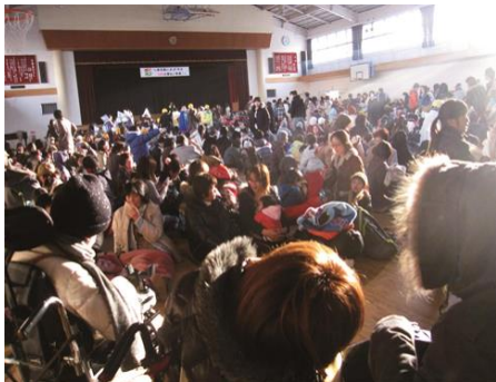
←避難所となった、 体育館の様子

ゆめ風基金に寄せられた寄付金と、ネットワークを活用して、災害時の障害者の困りごとを少しでも減らせたらと考えています。