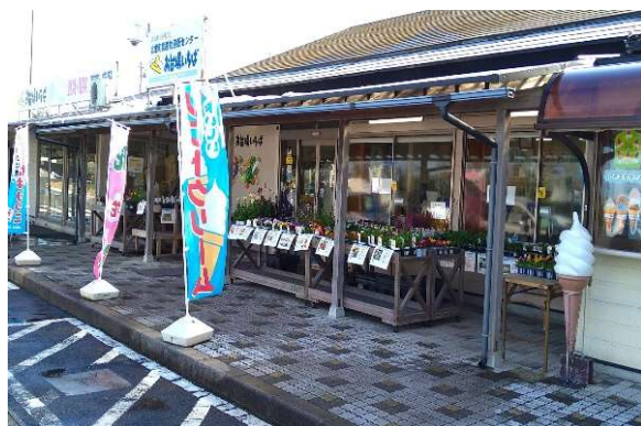
直売所 お台場いちば