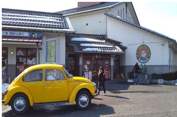
青山剛昌ふるさと館