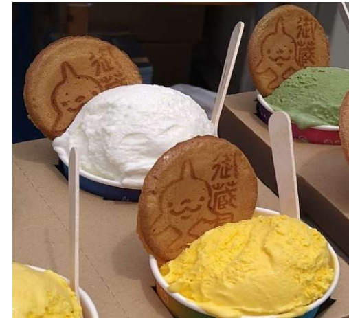
差別化されたせんべい